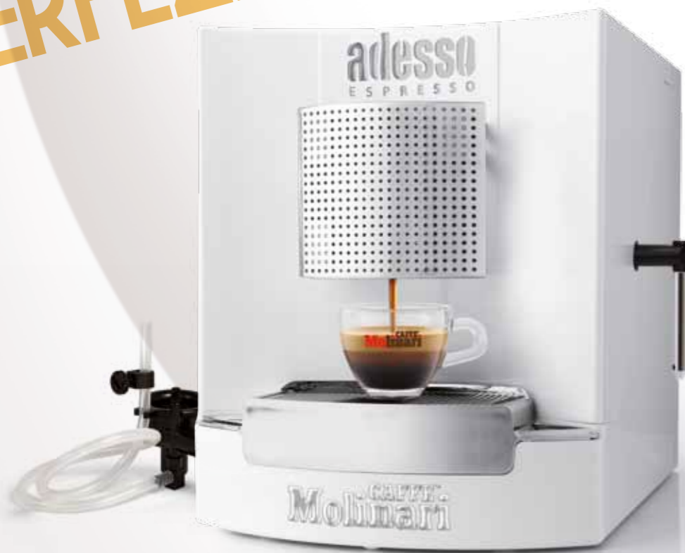
ACS CON CAPPUCCINATORE E LANCIA VAPORE ACS WITH CAPPUCCINO CREAMER AND STEAM NOZZLE